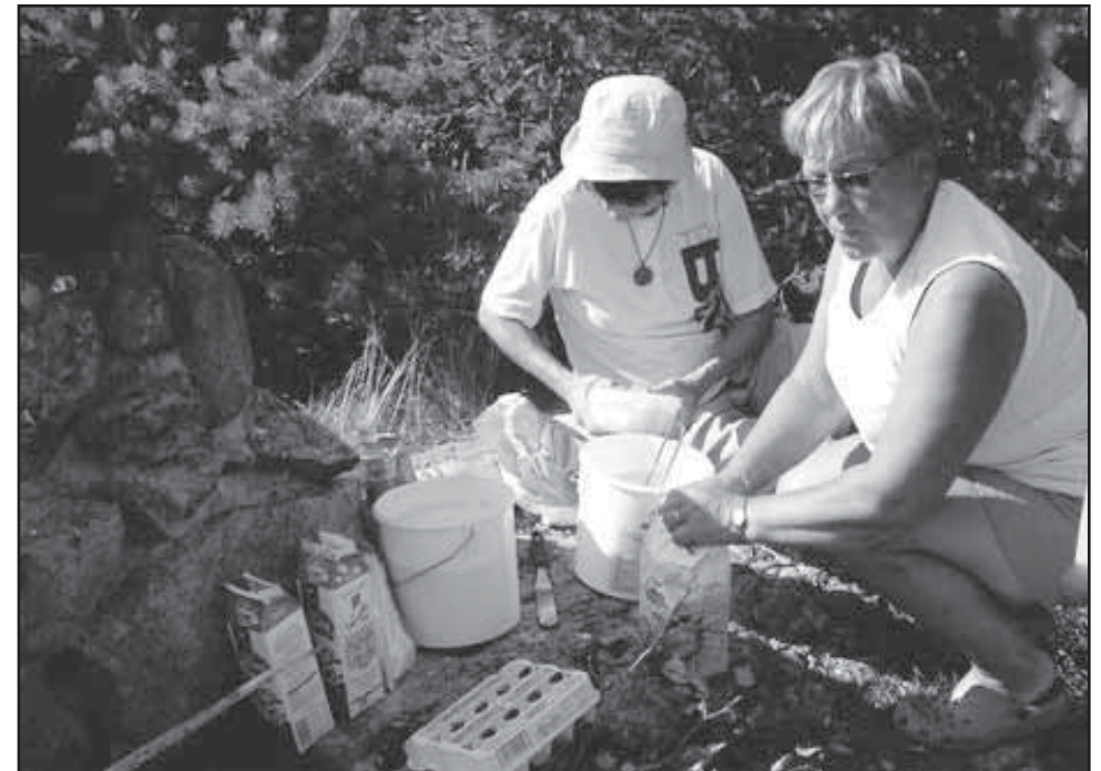
Lettutaikinaa syntyy, kun naisenergia toimii.